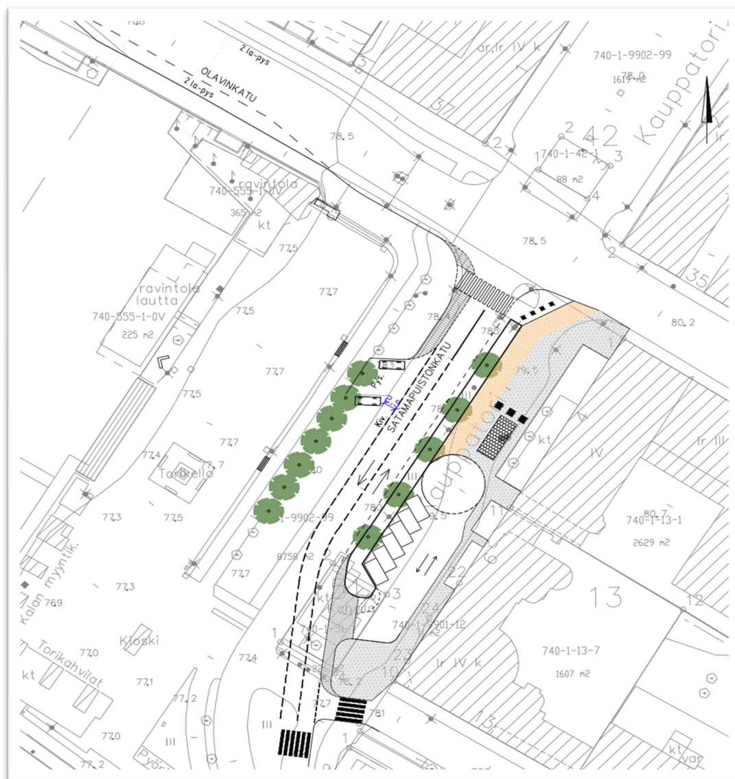
Kuva 5, Suunnitelmakartta, Olavinkadun erkanemiskaista, Ylätori suunnitelmakartta

Olavinkadun ja Satamapuistokadun kaistojen ja risteysalueen muutostyöt voidaan toteuttaa riippumatta Ylätorin toteutusaikataulusta. Olavinkadun kaistajärjestelyt mahdollistavat myöhemmin ylätorin suunnitellun toteutustavan. Kuvassa 5. esitetty molemmat suunnitelmat samassa suunnitelmakartassa.