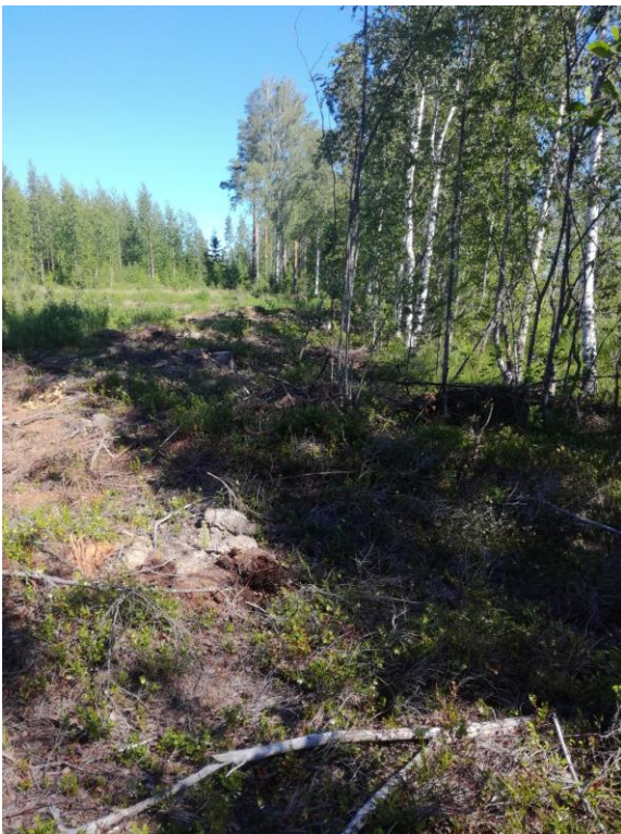
Kuva 6: Tissinniemen taustamaastoa