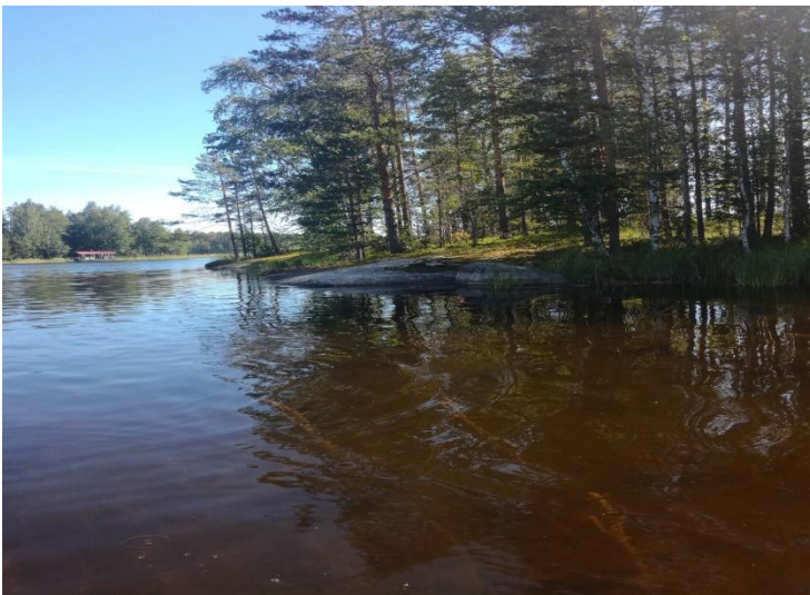
Kuva 3: Muutosalueen maastoa Suusaassa.

Suusaaren maasto on mäntyvaltaista sekametsää. Rannat ovat osin avokallioita. Saaren keskellä on vähäinen harjanne, muuten maasto melko tasaista. Saarella satunnaisesti vesilinnun pesiä ja järvellä esiintyy mm. kuikkia. Alueella ei mitään erityisiä luontoarvoja.