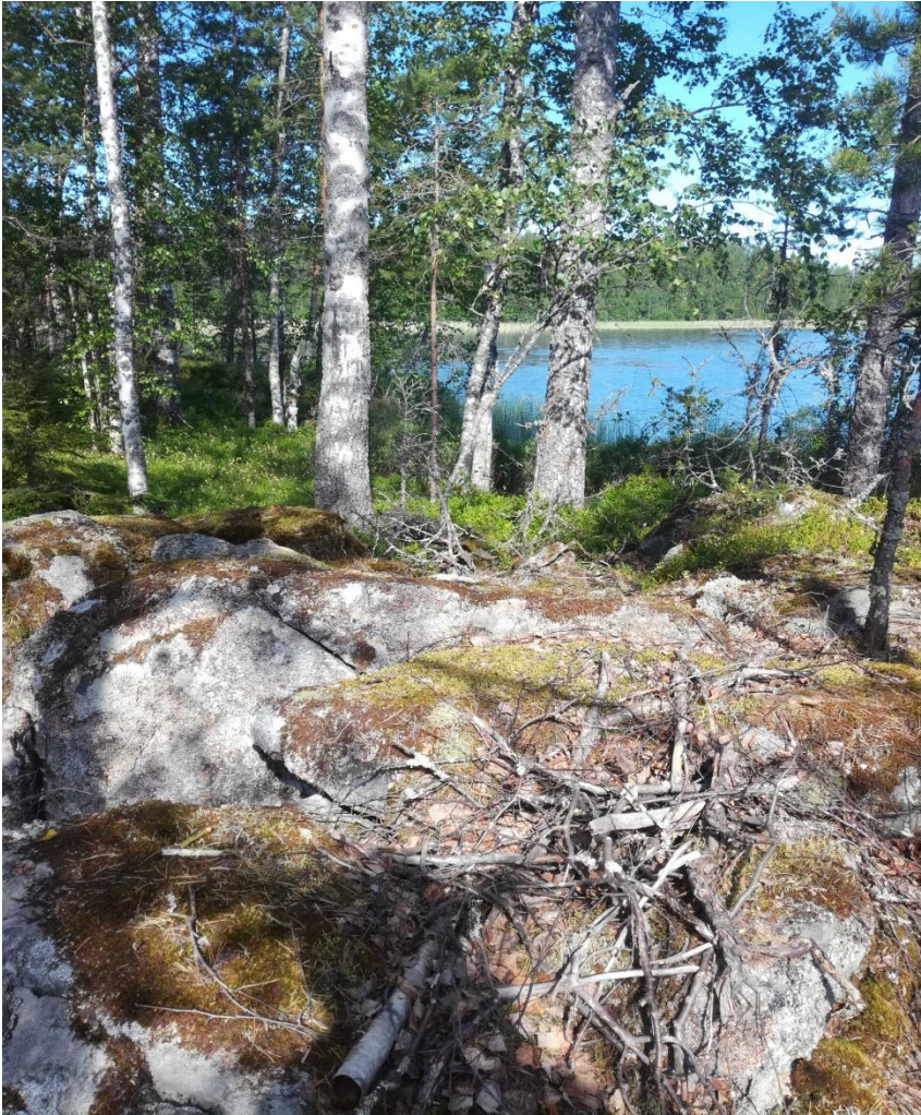
Kuva 4: Suusaaren maastoa

Tissinniemen alue on sekametsää ja talousmetsä käytössä. Kaavamuutosalueella on tehty hakkuita. Rannat ovat ruovikkoisia ja kosteita. Maasto melko tasaista. Ei erityisiä luontoarvoja.