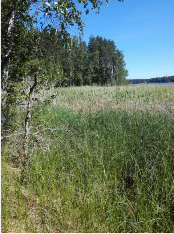
Kuva 5: Tissinniemen ranta-alue