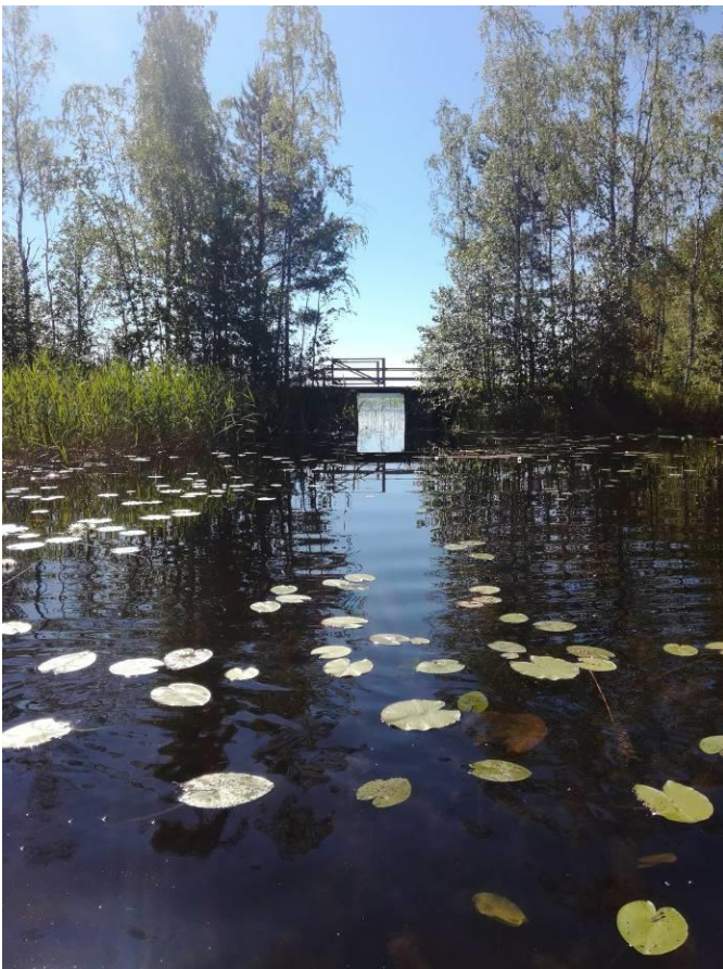
Kuva 7: Kulkuyhteys Suusaareen

Suusaareissa on toteutunut yksi lomarakennuksen rakennuspaikka ja sinne johtaa Suusaarentie Lahdenkyläntieltä. Alueella ei ole kunnallistekniikkaa.