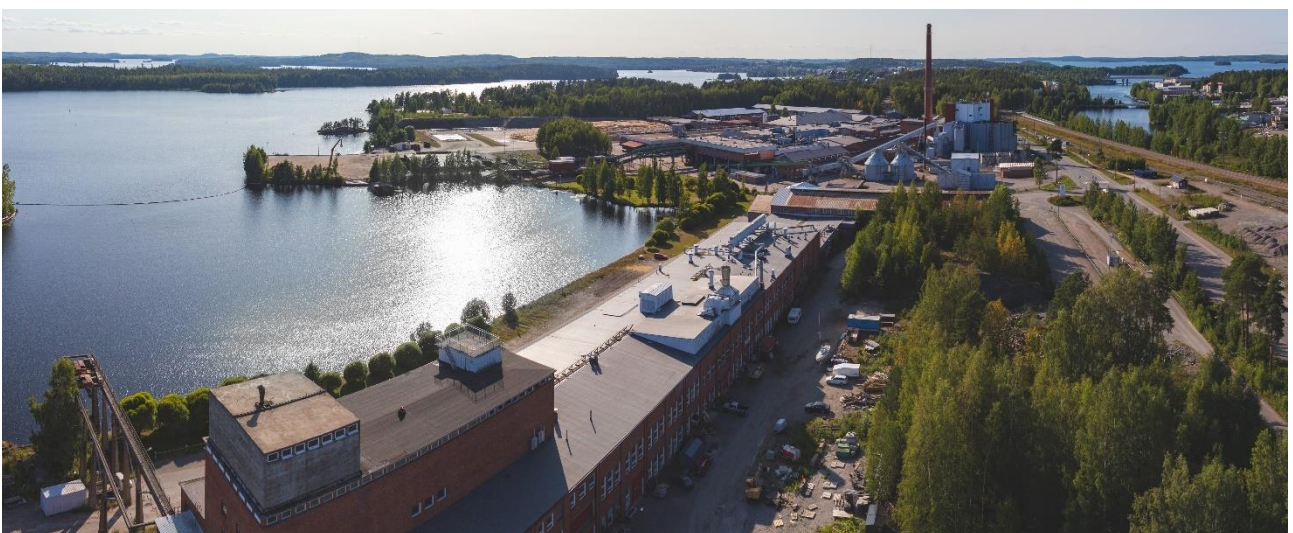
Kuva 4. Yritystalo Schauman ja tehdasalue.

Yhtiöllä on mahdollisuus aloittaa neuvottelut kiinteistön kaupasta.