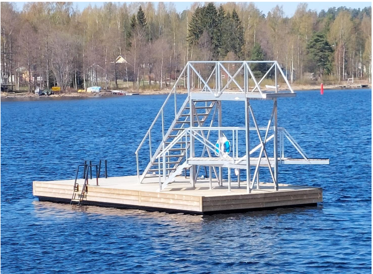
Uimahyppytorni Heikinpohjassa.