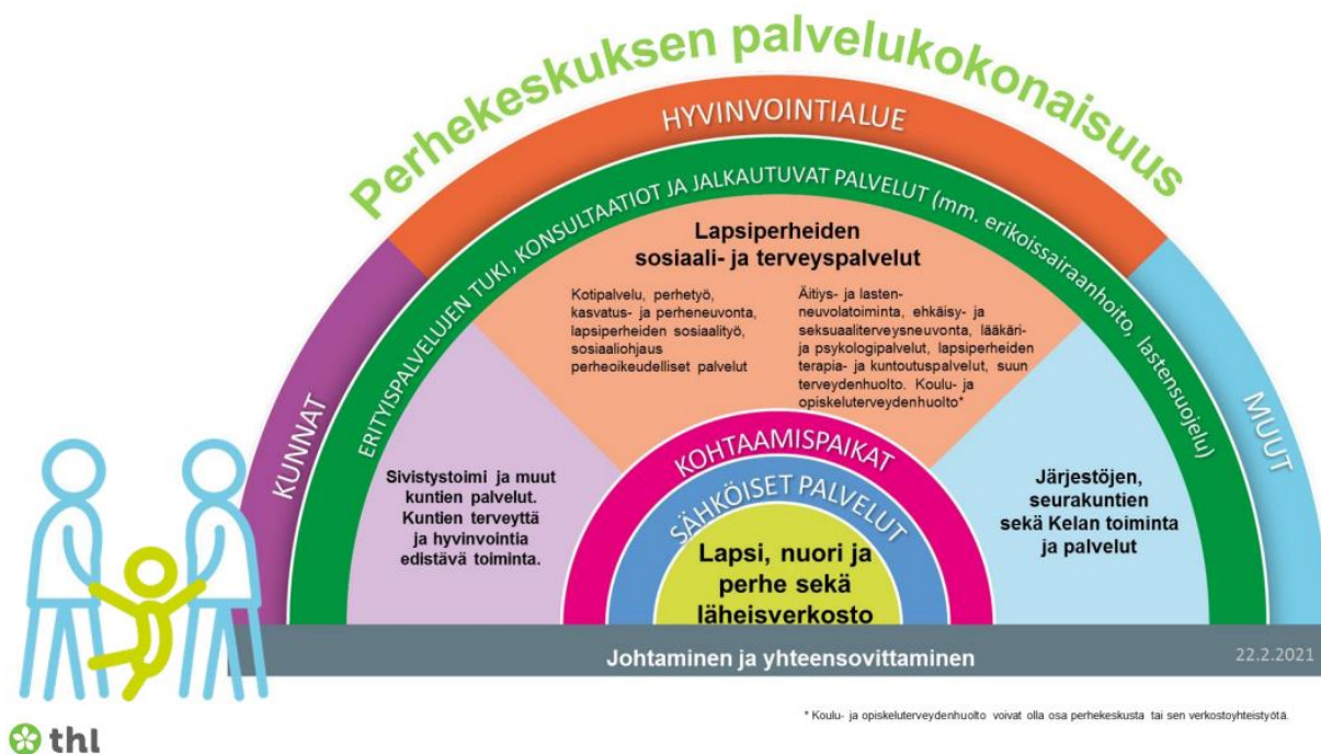
Kuva: Perhekeskuksen palvelukokonaisuus Perhekeskustoimintamalli (thl.fi)

Etelä-Savon perhekeskustoimintaa seurataan ja arvioidaan vuosittain. Seuranta sisältää monitoimijaisen kuntakohtaisen arvioinnin hyvinvointisuunnitelman mukaisten tavoitteiden toteutumisesta, perheille suunnatun kyselyn ja perhekeskustoimintaan liittyvien indikaattoreiden seurantatiedot. Tiedon keruu toteutetaan alkuvuodesta ja kootaan osana maakunnallista koordinoitua keväisin. (Etelä-Savon hyvinvointialue 2022.)