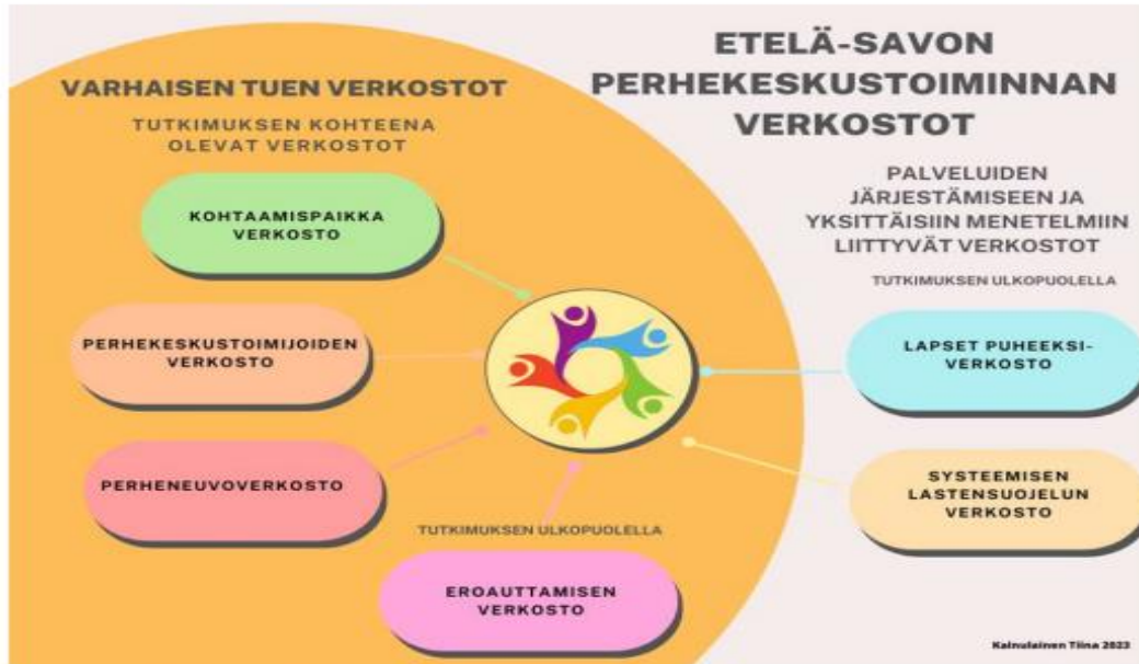
Kuvio 2. Etelä-Savon perhekeskustoiminnan verkostot.

Kuva: Etelä-Savon perhekeskusverkoston toimijat (Kainulainen 2023).