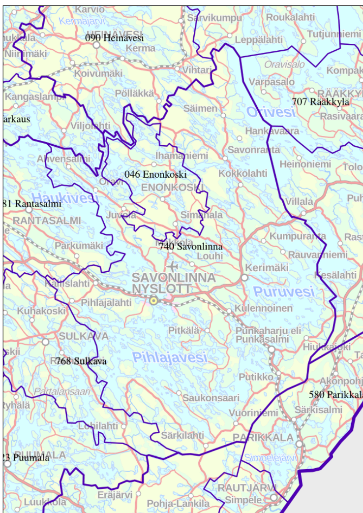
Kuva 1. Savonlinnan kaupunki ja lähikunnat 10 .

Savonlinnan kaupunki sijaitsee Etelä-Savon maakunnan itäosassa. Kaupungin pinta-ala on 3 597 km 2 , josta maa-aluetta on 2 238 km 2 ja vesistöä 1 359 km 2 8 . Naapurikuntia ovat Enonkoski, Heinävesi, Kitee, Liperi, Parikkala, Rantasalmi, Ruokolahti, Rääkkylä, Sulkava ja Varkaus. Kerimäki ja Punkaharju ovat liittyneet vuonna 2013 Savonlinnan kaupunkiin (kuva 1). Savonlinnassa on noin 8 800 kesämökkiä 9 . Savonlinna on sisävesisaaristoinen yksi Suomen kauneimmista kesämökki-paikkakunnista ja matkailukohteista Suur-Saimaan syleilyssä.