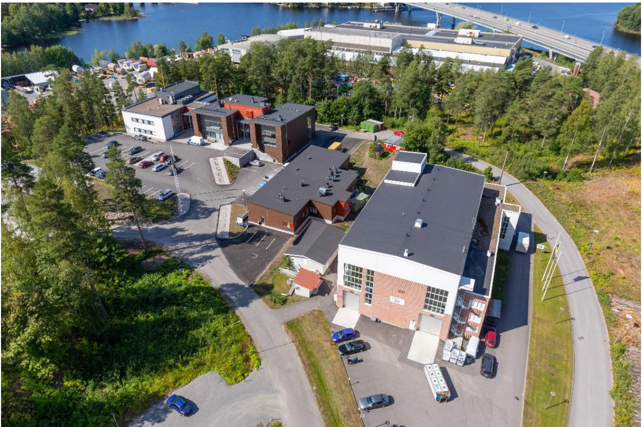
Kuva 1. Savonlinnan teknologiapuisto Noheva Lypsniemessä.

Charter-lentoyhteydet Euroopasta alkoivat kesällä 2023 ja tulevalle kesälle 2024 on sovittu 17 lentoa Savonlinnaan.