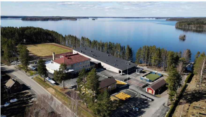
Kuva 4. Punkaharjun uusi puukoulu.

Savonlinnan Veden vesihuoltoverkoston laskennallinen korjausvelka on 47,7 M€. Vuosittainen saneeraustarve on noin 2,7 M€, joka on varattu talousarvioon.