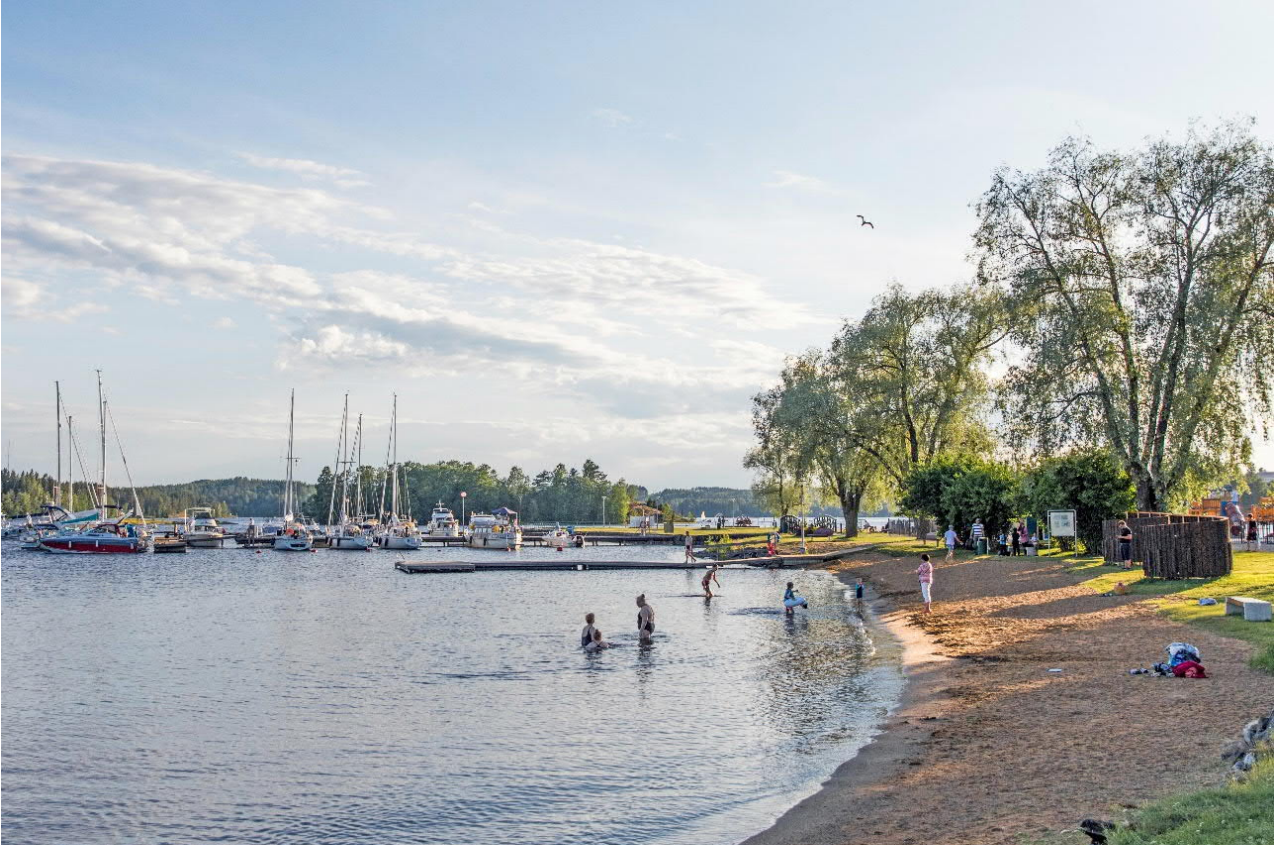
Kuva 3. Kaupungin uimaranta keskustassa.

edellisvuoden määrän tasolla, samoin kuin roskaamistapaukset eivät ole lisääntyneet.