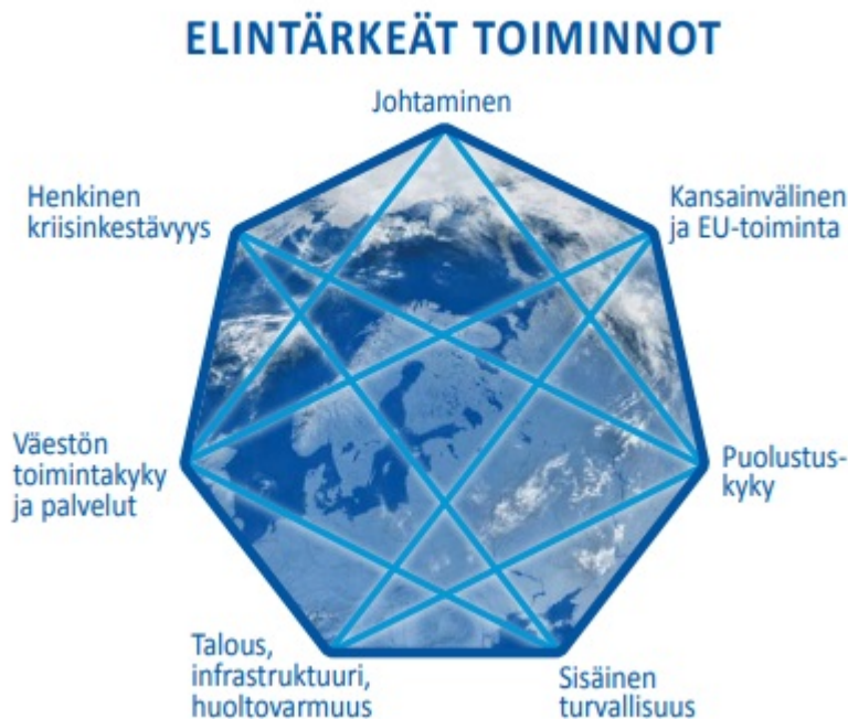
Kuva 2. Yhteiskunnan elintärkeät toiminnot; YTS 2017

Elintärkeät toiminnot ovat yhteiskunnan toimivuuden kannalta välttämättömiä, kaikissa tilanteissa ylläpidettäviä toimintokokonaisuuksia. Yhteiskunnan elintärkeät toiminnot ulottuvat useiden toimijoiden lakisääteisiin tehtäviin ja osin alueille, joille ei voida määritellä yhtä ainoaa vastuutahoa.