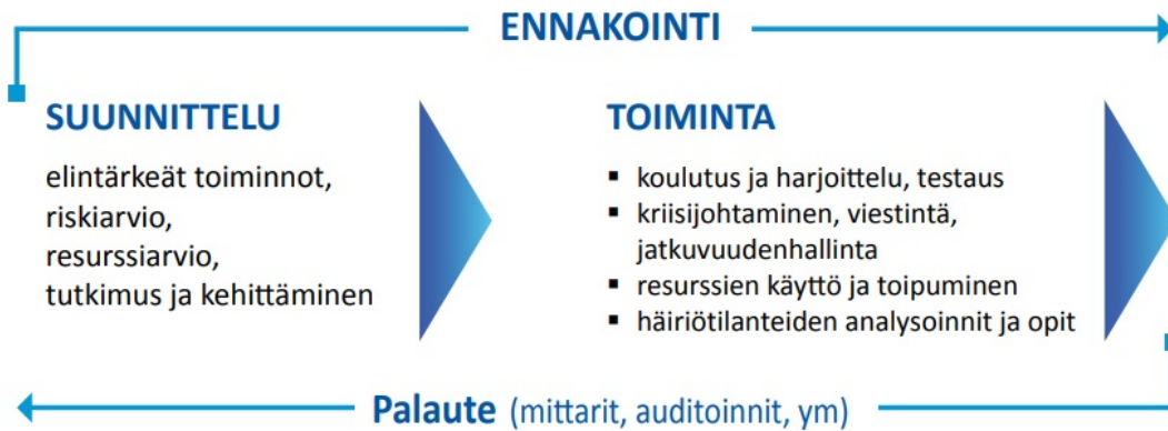
Kuva 1. Varautumisen prosessi (YTS 2017)