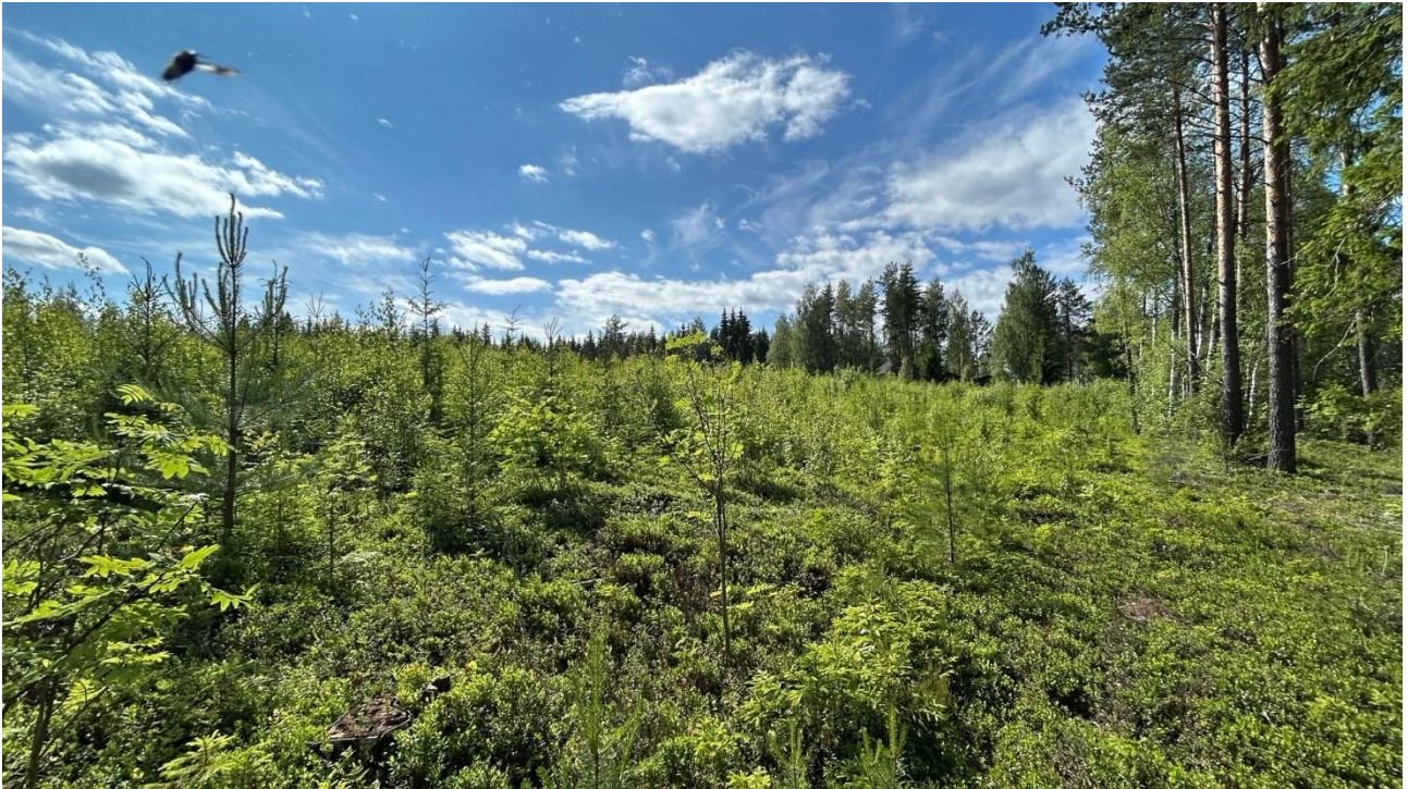
Kuva 4. Suunnittelualueen rantavyöhykkeen takana olevan rinteiden taimikko.

Yleispiirteiltään alue on rantaa kohden loivasti laskeutuva rinne, joka on ihmistoiminnan muovaamaa. Rantavyöhykkeen takana on toteutettu päätehakkuu siten, että tällä hetkellä puusto puuttuu kokonaan ja pensaskerroksessa kasvavat männyn, kuusen sekä rauduskoivun taimet. Päätehakkuun toteutuksesta arvioidaan kuluneen alle 10 vuotta (kuva 4.).