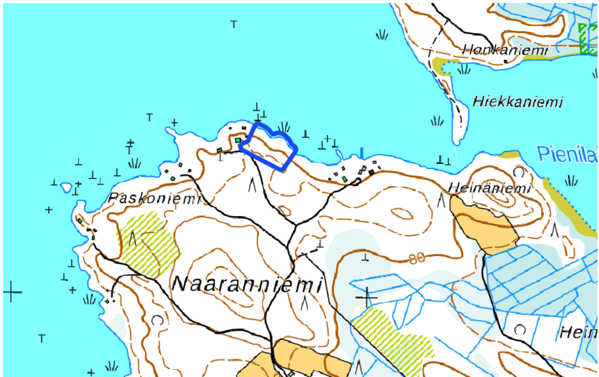
Kuva 2. Selvitysalueen rajaus sinisellä viivalla maastotietokannalla